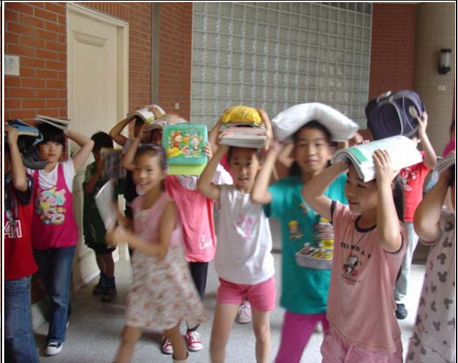
不定期演練，加深學習。