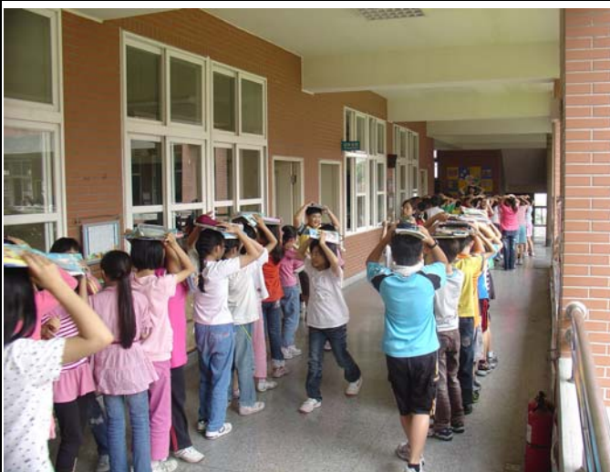
不定期演練，加深學習。